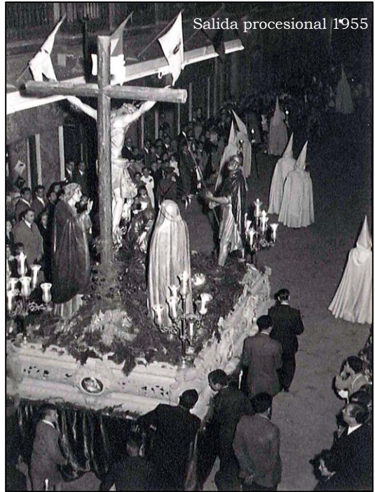
Salida procesional 1955