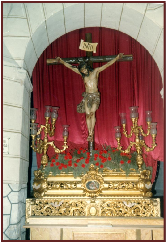
Capilla del Santísimo Cristo de la Caridad, 1985

Hermandad del Santísimo Cristo de la Caridad Parroquia de Santiago Apóstol, Ciudad Real